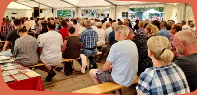
Gottesdienst beim Reit- und Springturnier